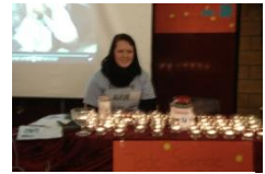
„Solling hilft Haiti“

8 von 10 Sternen. Alles in allem war es ein kleiner, heiterer und familienfreundlicher Basar, der einen Besuch wert war.