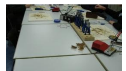
Ein Highlight: Sterne löten