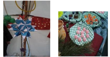
Selbstgemacht: Seife und ein Stern