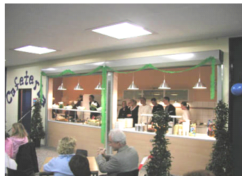
Unsere Cafeteria - Die Attraktion in den Pausen